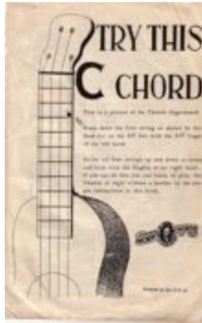
My Mom's Instructional Book

and could play the trumpet, but he didn't play the ukulele. I also know that my mom had an instructional book on the ukulele and I still have it at home.