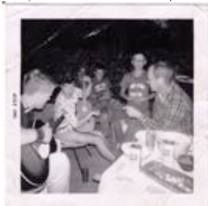
Another session with the ukulele