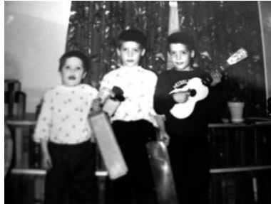
Mis hermanos y yo. Soy yo en la parte central de la foto.

Ella muchas veces cantaba la canción caribe “Maryanne.” Siempre recuerdo la canción y siempre me ha gustado. En el año 2006 yo grabé una versión con armonía de tres partes.