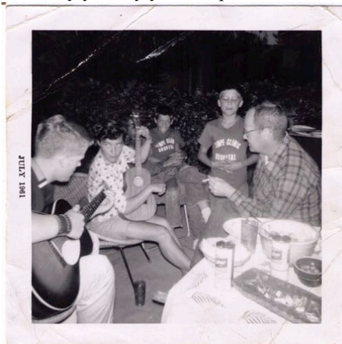
Otra sesión con el ukelele

Cuando mencioné a mi hermana que pensaba escribir de nuestra madre y su ukelele ella dijo: