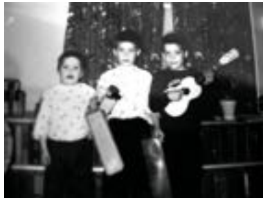
My brothers and I. I’m in the middle of the picture.

She often played the song “Maryanne.” I always have remembered the song and I’ve always liked it. In 2006, I recorded a version with three-part harmony.